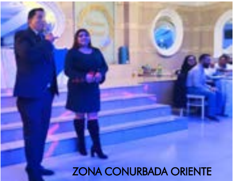
ZONA CONURBADA ORIENTE