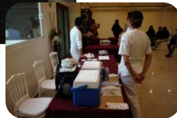
Personal capacitado atendió a los compañeros trabajadores.