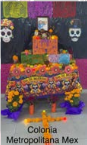
Colonia Metropolitana Mex