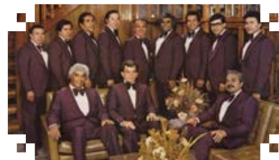
La Sonora Santanera

-Discografía: Sonora Santanera, Marco Antonio Solís, Vicente Fernández, Javier Solís, José Alfredo Jiménez, los Tigres del Norte, Los Tucanes de Tijuana, Los Vaskez, Los Flamers; Rigo Tovar.