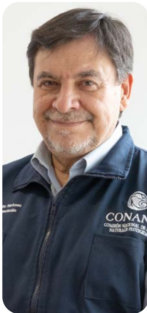
Pedro Álvarez Icaza Longoria, titular de la Comisión Nacional de Áreas Naturales Protegidas (Conanp)

Fuente Informativa: Agricultura, Conanp, Fundación Pro Cuatrociénegas y WWF-México.